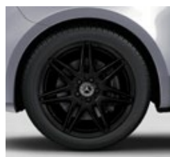
48,3 cm (19") AMG platišča iz lahke kovine (R1U)