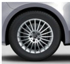
43,2 cm (17") platišča iz lahke kovine (RK8)