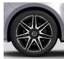
48,3 cm (19") AMG platišča iz lahke kovine (RK4)