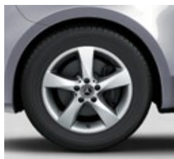
43,2 cm (17") platišča iz lahke kovine (RL8)