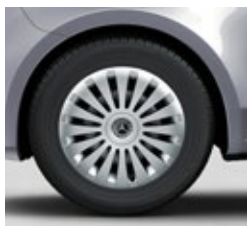
43,2 cm (17") jeklena platišča (RS7)