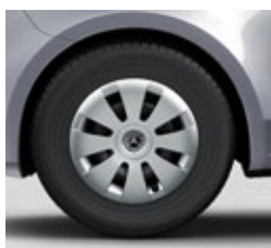
40,6 cm (16") jeklena platišča (RS3)