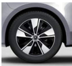
45,7 cm (18") platišča iz lahke kovine (R1P)