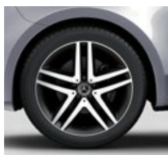
48,3 cm (19") platišča iz lahke kovine (RL3)