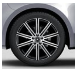
48,3 cm (19") platišča iz lahke kovine (R1Q)