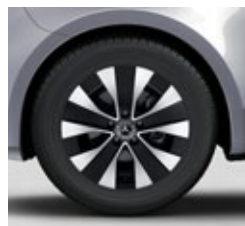
43,2 cm (17") platišča iz lahke kovine (R1N)