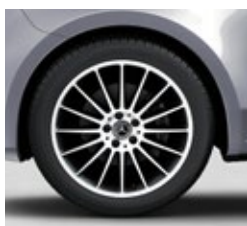
48,3 cm (19") platišča iz lahke kovine (RK3)