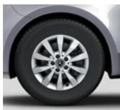
40,6 cm (16") platišča iz lahke kovine (RL5)